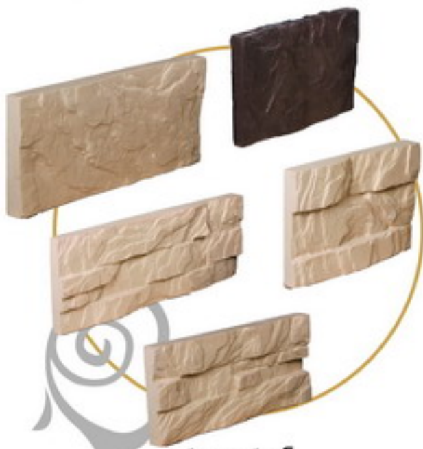
آنتیک ۱۲ تکه