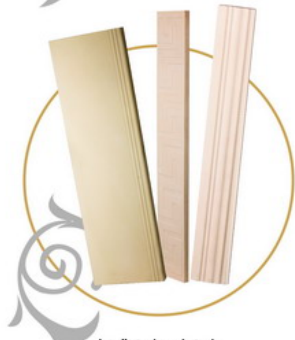
پله / زیر پله / قرنیز