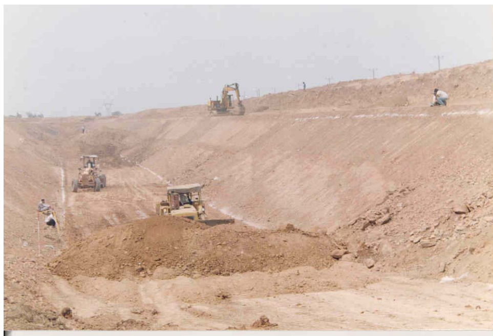
استفاده از آهک جهت تثبیت بستر کانال