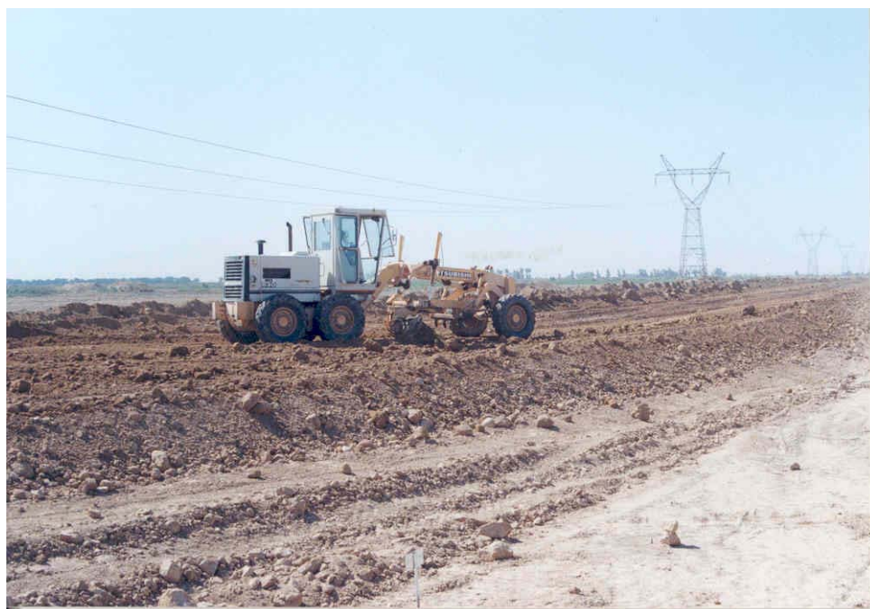
استفاده از آهک جهت تثبیت بستر راه