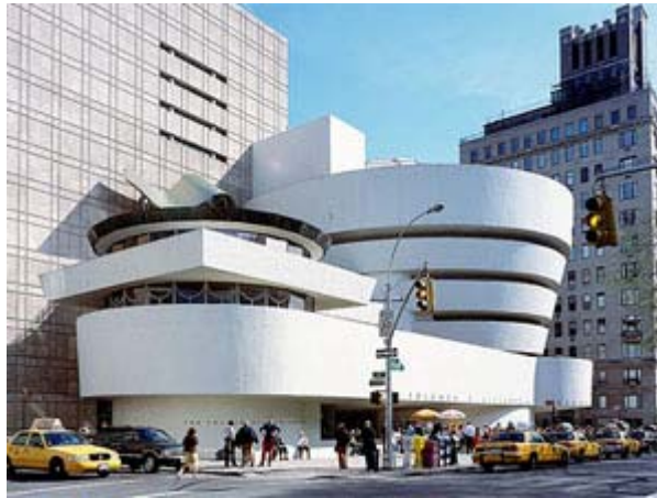
رایت - موزه گوگنهایم ، نیویورک ۱۹۵۶

با پایان جنگ جهانی و نیاز شدید به ترمیم خرابی های جنگ و تولید انبوه ساختمان ، گرایش به سمت معماری مدرن افزایش یافت . لذا استفاده از تکنولوژی روز ، مصالح مدرن ، پیش ساختگی ، عملکرد گراپی و دوری از سبکهای پر زرق و برق تاریخی مورد توجه قرار گرفت . در این دوره معماری مدرن به عنوان تنها سبک مهم و آوانگارد در غرب مطرح شد و دامنه نفوذ آن به صورت یک سبک جهانی در اقصا نقاط گیتی گسترش یافت.